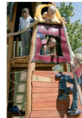
Märchenspielplatz mit Rapunzelturm und Frau Holle-Schaukel