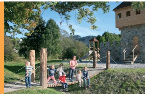
Ritterspielplatz mit Hängebrücke mit Burgturm

Tipp: Gegen geringes Geld können die Kinder hier mit Elektroautos um die Wette fahren