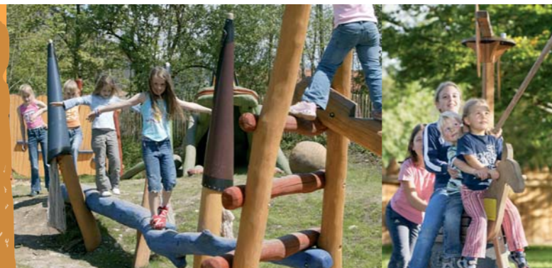
„Die sieben Zwerge“ im Märchenspielplatz