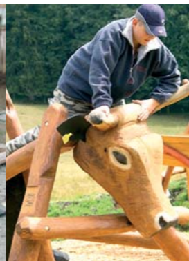
„Rodeo“ im Kuh-Kuh-Spielplatz und Balancierparcour