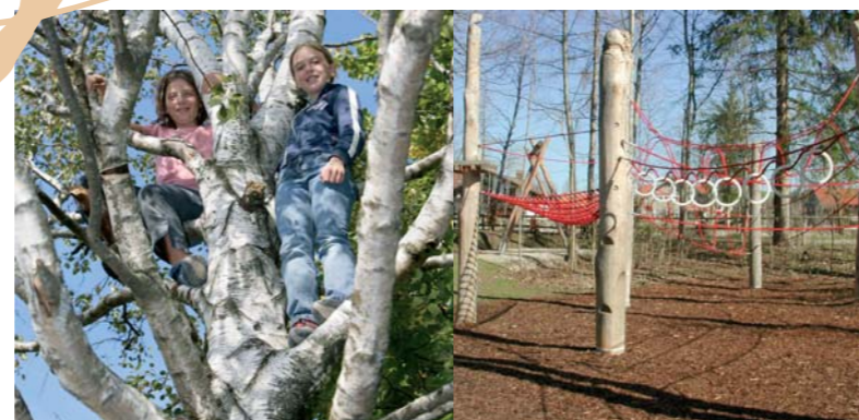
Kletterbäume auf dem Ritterspielplatz

Für Fahrradhelme gilt: Diese immer auf der Straße, nie aber auf dem Spielplatz tragen. Lose Befestigungsbänder der Helme können bei Spielgeräten gefährlich werden.